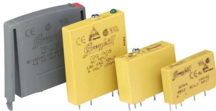
70L-IAC 70G-IAC 70-IAC 70M-IAC