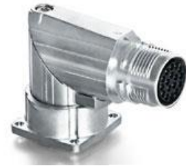
Contact Arrangement mating view

A ED C 047 NN 00 00 051A 000 A G C 047 N 00 00 051A 000