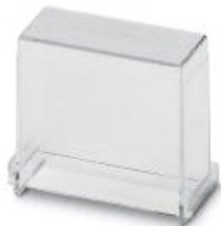
Covering hood, for the contact and dust-protected encapsulation of the components, in transparent design. Height: 35 mm, width: 17 mm

Please be informed that the data shown in this PDF Document is generated from our Online Catalog. Please find the complete data in the user's documentation. Our General Terms of Use for Downloads are valid ( http://phoenixcontact.com/download )