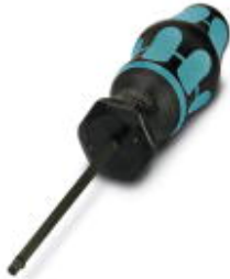
Torque screwdriver, with preset torque of 0.4 Nm and 4 mm hexagonal drive for M12 connectors

Please be informed that the data shown in this PDF Document is generated from our Online Catalog. Please find the complete data in the user's documentation. Our General Terms of Use for Downloads are valid ( http://download.phoenixcontact.com )