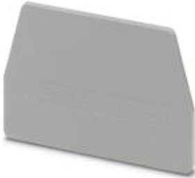
End cover, Length: 61 mm, Width: 2.2 mm, Color: gray

Please be informed that the data shown in this PDF Document is generated from our Online Catalog. Please find the complete data in the user's documentation. Our General Terms of Use for Downloads are valid ( http://download.phoenixcontact.com )