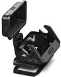
HEAVYCON EVO panel mounting base, plastic, B16, with single locking latch, height: 30.5 mm, with flat gasket, with protective cover

Please be informed that the data shown in this PDF Document is generated from our Online Catalog. Please find the complete data in the user's documentation. Our General Terms of Use for Downloads are valid ( http://download.phoenixcontact.com )