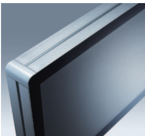
Side groove design for Flexible peripheral device