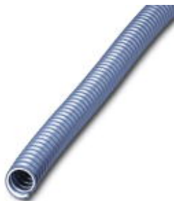
Protective hose, spring steel wire with PU coating, highly stranded

Please be informed that the data shown in this PDF Document is generated from our Online Catalog. Please find the complete data in the user's documentation. Our General Terms of Use for Downloads are valid ( http://phoenixcontact.com/download )