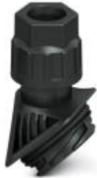
EVO plastic cable gland with bayonet locking, for housing series D, size M25, cable diameter: 9 - 17 mm.

Please be informed that the data shown in this PDF Document is generated from our Online Catalog. Please find the complete data in the user's documentation. Our General Terms of Use for Downloads are valid ( http://phoenixcontact.com/download )