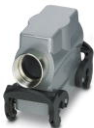
HEAVYCON B16 sleeve housing, with double locking latch, height: 72 mm, with 1 x M32 gland, lateral cable outlet

Please be informed that the data shown in this PDF Document is generated from our Online Catalog. Please find the complete data in the user's documentation. Our General Terms of Use for Downloads are valid ( http://phoenixcontact.com/download )