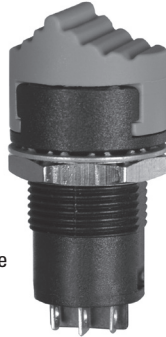
Raised Button Style