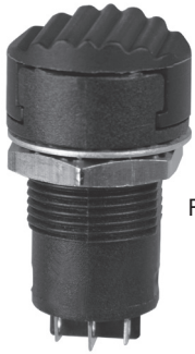
Flush Button Style