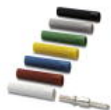
Insulating sleeve, Color: red