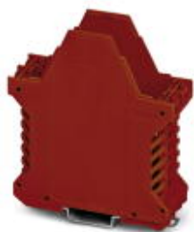
Component housing, length: 99 mm, with vents, Lower part, color: red, width: 35 mm, height: 114.5 mm

Please be informed that the data shown in this PDF Document is generated from our Online Catalog. Please find the complete data in the user's documentation. Our General Terms of Use for Downloads are valid ( http://phoenixcontact.com/download )