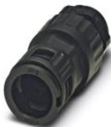
Cable gland, metric thread, IP66 protection, with strain relief

Please be informed that the data shown in this PDF Document is generated from our Online Catalog. Please find the complete data in the user's documentation. Our General Terms of Use for Downloads are valid ( http://phoenixcontact.com/download )