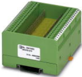
Custom circuit module, consisting of housing, MKDS 3 connection terminal blocks and PCB

Please be informed that the data shown in this PDF Document is generated from our Online Catalog. Please find the complete data in the user's documentation. Our General Terms of Use for Downloads are valid ( http://phoenixcontact.com/download )