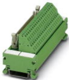
VARIOFACE COMPACT LINE, interface module for 32 channels, with LED, for assembly on DIN rail NS 35/7.5, spring-cage connection

Please be informed that the data shown in this PDF Document is generated from our Online Catalog. Please find the complete data in the user's documentation. Our General Terms of Use for Downloads are valid ( http://phoenixcontact.com/download )