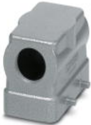
HEAVYCON B10 sleeve housing, for double locking latch, height: 56 mm, with 1 x M20 thread, lateral cable outlet

Please be informed that the data shown in this PDF Document is generated from our Online Catalog. Please find the complete data in the user's documentation. Our General Terms of Use for Downloads are valid ( http://phoenixcontact.com/download )