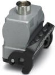
HEAVYCON B10 coupling housing, with single locking latch, height: 62 mm, with 1 x Pg16 gland, straight cable outlet

Please be informed that the data shown in this PDF Document is generated from our Online Catalog. Please find the complete data in the user's documentation. Our General Terms of Use for Downloads are valid ( http://phoenixcontact.com/download )