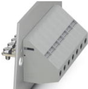
Panel feed-through terminal block, Connection method: Screw connection, Screw connection, Load current : 125 A, Cross section: 6 mm 2 - 35 mm 2 , AWG 8 - 3, Width: 15.1 mm, Color: gray

Please be informed that the data shown in this PDF Document is generated from our Online Catalog. Please find the complete data in the user's documentation. Our General Terms of Use for Downloads are valid ( http://download.phoenixcontact.com )