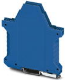
Component housing, length: 99 mm, Lower part, color: blue, width: 12.5 mm, height: 114.5 mm

Please be informed that the data shown in this PDF Document is generated from our Online Catalog. Please find the complete data in the user's documentation. Our General Terms of Use for Downloads are valid ( http://phoenixcontact.com/download )