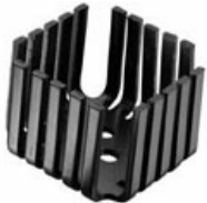
Representative Photo Only

Square Basket heat sink featuring straight fins. For dual device