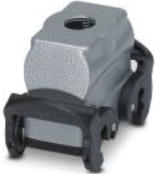
HEAVYCON B10 coupling housing, with double locking latch, height: 62 mm, with 1 x M20 thread, straight cable outlet

Please be informed that the data shown in this PDF Document is generated from our Online Catalog. Please find the complete data in the user's documentation. Our General Terms of Use for Downloads are valid ( http://phoenixcontact.com/download )