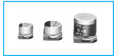
Marking color : Black print (except height : 10mm) White print on a brown sleeve (ø8x10L, ø10x10L)