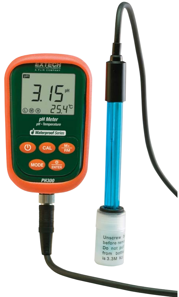
Large blue backlit dual LCD display with calibration and memory indicators