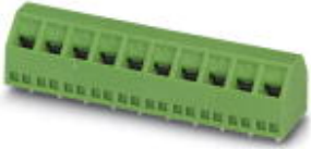
The figure shows a 10-position version of the product

PCB terminal block, nominal current: 13.5 A, nom. voltage: 400 V, pitch: 5 mm, number of positions: 4, connection method: Screw connection with tension sleeve, mounting: Wave soldering, conductor/PCB connection direction: 45 °, color: green