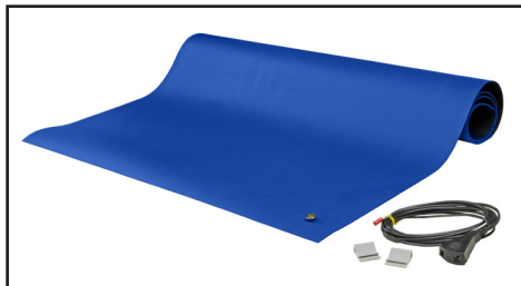
8900 Table Mat Kit shown with included hardware