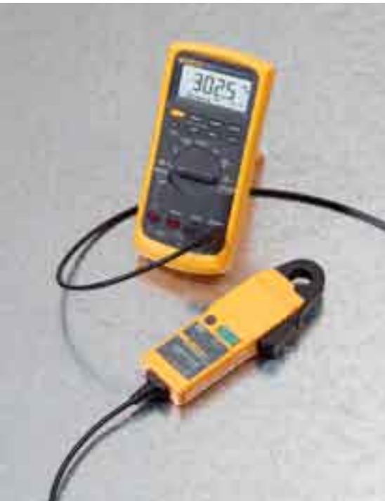
i30 connected to a Fluke 87V Digital Multimeter.

Fluke. Keeping your world up and running.