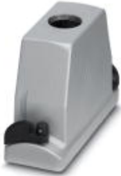
HEAVYCON ADVANCE EMV sleeve housing B24, with bayonet locking, height 100 mm, with 1x M40 thread, straight cable outlet

Please be informed that the data shown in this PDF Document is generated from our Online Catalog. Please find the complete data in the user's documentation. Our General Terms of Use for Downloads are valid ( http://download.phoenixcontact.com )