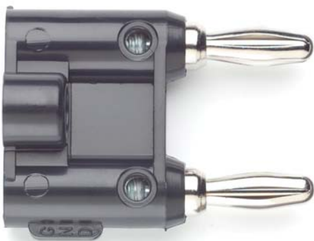
Model MDP, 4892, 4898 Stackable Double Banana Plug with Cable Guide