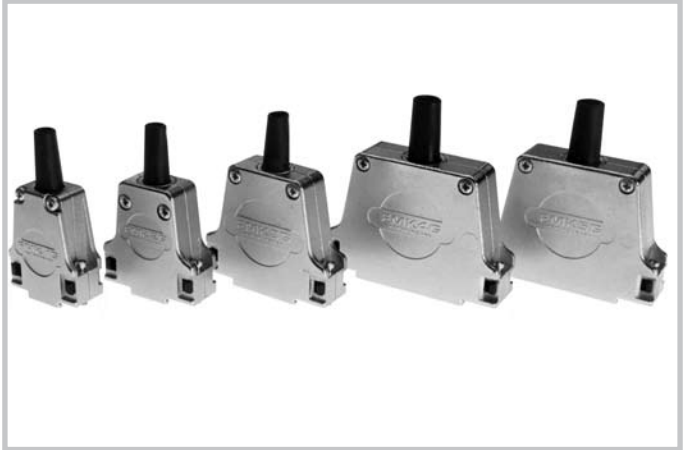
Metal hoods, series FMK...G, in shell sizes 1 - 5. Metallhauben der Serie FMK...G in den Gehäusegrößen 1 - 5.