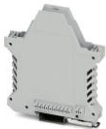
Component housing, length: 99 mm, color: light gray

Please be informed that the data shown in this PDF Document is generated from our Online Catalog. Please find the complete data in the user's documentation. Our General Terms of Use for Downloads are valid ( http://phoenixcontact.com/download )