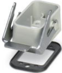
Panel mounting base with single locking engagement nose, straight design

Please be informed that the data shown in this PDF Document is generated from our Online Catalog. Please find the complete data in the user's documentation. Our General Terms of Use for Downloads are valid ( http://download.phoenixcontact.com )