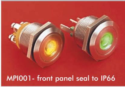
MPI001- front panel seal to IP66