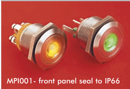
MPI001- front panel seal to IP66