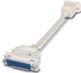
RS-232 cable, 9-pos. D-SUB socket 25-pos on D-SUB socket

Please be informed that the data shown in this PDF Document is generated from our Online Catalog. Please find the complete data in the user's documentation. Our General Terms of Use for Downloads are valid ( http://phoenixcontact.com/download )