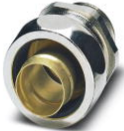
Cable gland made from brass with metric thread, IP65 protection

Please be informed that the data shown in this PDF Document is generated from our Online Catalog. Please find the complete data in the user's documentation. Our General Terms of Use for Downloads are valid ( http://phoenixcontact.com/download )