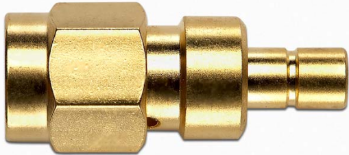
Model 72976 SMA (M) TO SMB (M)