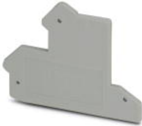
End cover, Length: 56.7 mm, Width: 2.5 mm, Height: 52.3 mm, Number of positions: 1, Color: gray

Please be informed that the data shown in this PDF Document is generated from our Online Catalog. Please find the complete data in the user's documentation. Our General Terms of Use for Downloads are valid ( http://phoenixcontact.com/download )