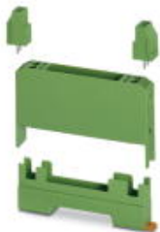
Electronic housing set, consisting of electronic housing and printed circuit termination blocks, pitch 5

Please be informed that the data shown in this PDF Document is generated from our Online Catalog. Please find the complete data in the user's documentation. Our General Terms of Use for Downloads are valid ( http://phoenixcontact.com/download )