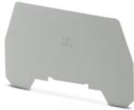
Separating plate, Length: 72 mm, Width: 0.8 mm, Color: gray

Please be informed that the data shown in this PDF Document is generated from our Online Catalog. Please find the complete data in the user's documentation. Our General Terms of Use for Downloads are valid ( http://download.phoenixcontact.com )