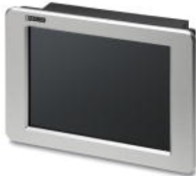
15-in. display shown

Please be informed that the data shown in this PDF Document is generated from our Online Catalog. Please find the complete data in the user's documentation. Our General Terms of Use for Downloads are valid ( http://download.phoenixcontact.com )