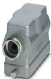
HEAVYCON B16 sleeve housing, for single locking latch, height: 76 mm, with 1 x Pg21 screw connection, lateral cable outlet

Please be informed that the data shown in this PDF Document is generated from our Online Catalog. Please find the complete data in the user's documentation. Our General Terms of Use for Downloads are valid ( http://phoenixcontact.com/download )