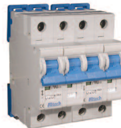
Four Pole Please contact Altech.

Non-standard current ratings available. Minimum quantities may apply. Please contact Altech for further details.