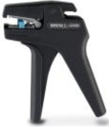
Stripping tool, for conductors and cables of 0.08 to 2.5 mm diameter

Please be informed that the data shown in this PDF Document is generated from our Online Catalog. Please find the complete data in the user's documentation. Our General Terms of Use for Downloads are valid ( http://download.phoenixcontact.com )