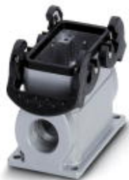
Box mounting base, with double locking latch, height: 74 mm, with gland, 1 x M25

Please be informed that the data shown in this PDF Document is generated from our Online Catalog. Please find the complete data in the user's documentation. Our General Terms of Use for Downloads are valid ( http://phoenixcontact.com/download )