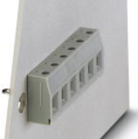
The illustration shows version VDFK 4 in gray

Please be informed that the data shown in this PDF Document is generated from our Online Catalog. Please find the complete data in the user's documentation. Our General Terms of Use for Downloads are valid ( http://download.phoenixcontact.com )