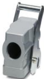
HEAVYCON sleeve housing B24, with main latch, height 76 mm, with 1 x M32 thread , lateral conductor outlet

Please be informed that the data shown in this PDF Document is generated from our Online Catalog. Please find the complete data in the user's documentation. Our General Terms of Use for Downloads are valid ( http://phoenixcontact.com/download )