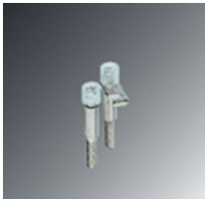
Switching bridge, 2-pos.

Please be informed that the data shown in this PDF Document is generated from our Online Catalog. Please find the complete data in the user's documentation. Our General Terms of Use for Downloads are valid ( http://download.phoenixcontact.com )