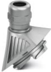
EVO EMC cable gland with bayonet locking, B series, size M25, cable diameter: 11 - 16 mm

Please be informed that the data shown in this PDF Document is generated from our Online Catalog. Please find the complete data in the user's documentation. Our General Terms of Use for Downloads are valid ( http://phoenixcontact.com/download )