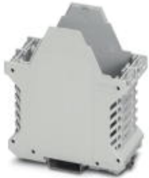
Component housing, length: 99 mm, Lower part, color: light gray, width: 45 mm, height: 114.5 mm

Please be informed that the data shown in this PDF Document is generated from our Online Catalog. Please find the complete data in the user's documentation. Our General Terms of Use for Downloads are valid ( http://phoenixcontact.com/download )